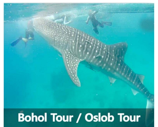
Bohol Tour / Oslob Tour

滞在期間中、勉強からのストレスを取り除きフレッシュできる様ゴルフを楽しんで頂けます。SMEAGの生徒であればAlta Vistaカントリークラブにあるゴルフクラブにてリーズナブルな価格でゴルフを楽しむことができます。