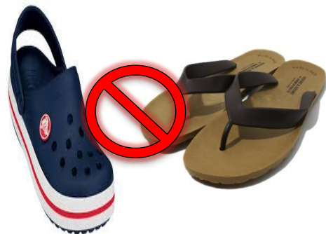
クロックス& ビーチサンダル