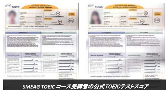
SMEAG TOEIC コース受講者の公式TOEICテストスコア