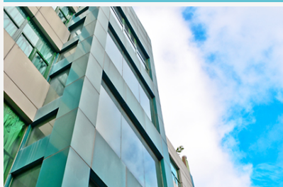
Buena Vida Suites Capitol